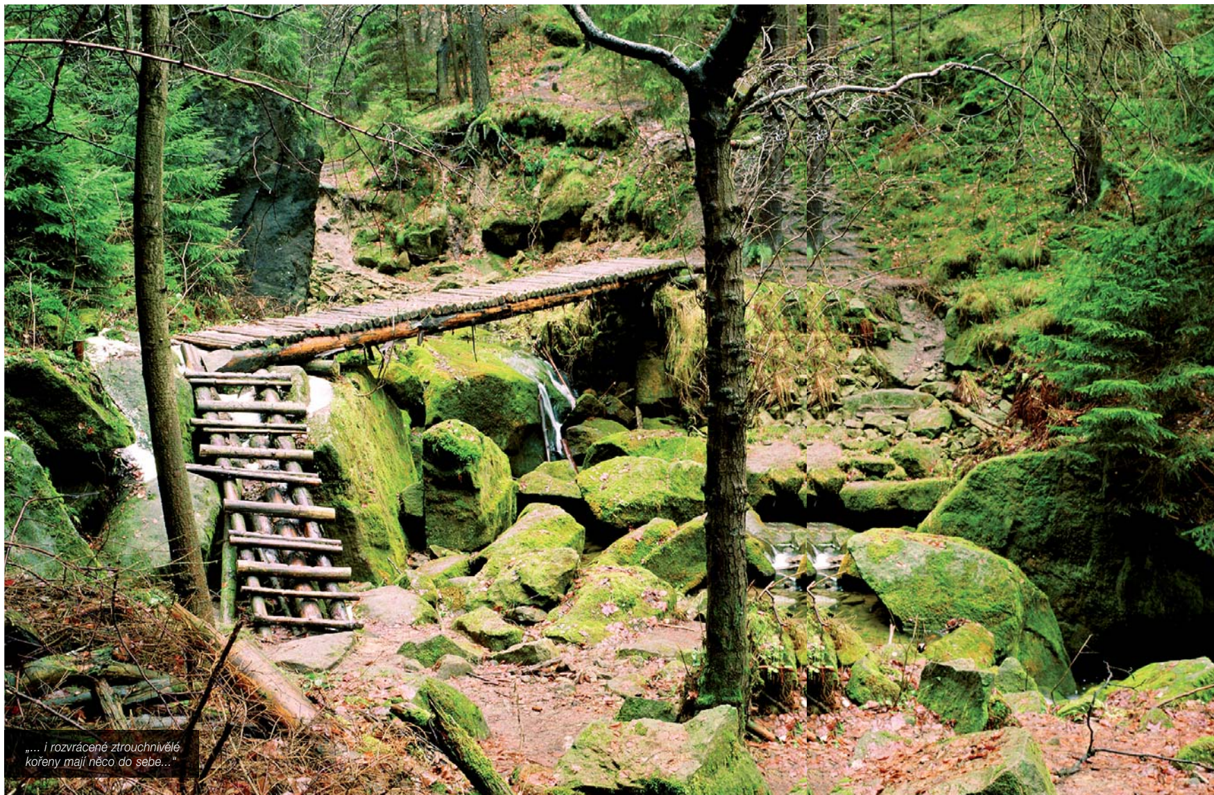
.... I rozvrácené ztrouchnivělé kořeny mají něco do sebe..."